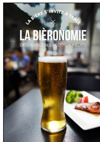
Atelier Mets et bière